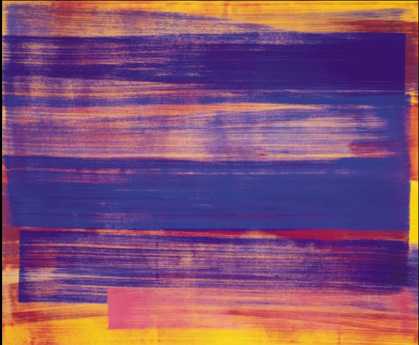
"LICHT", 2000, EITEMPERA MIT PIGMENT AUF NESSEL, 178 X 148 CM, GERAHMT