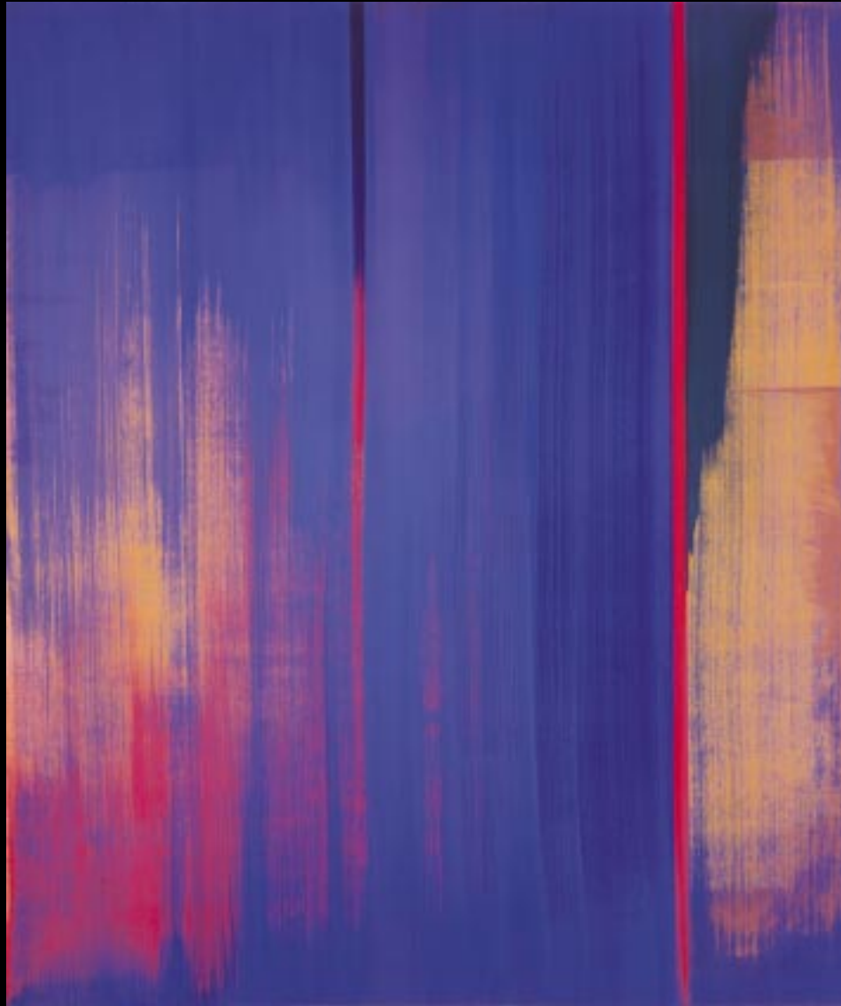
"GESCHWINDIGKEIT, VERTIKAL", 2000, 148 X 178 CM, GERAHMT