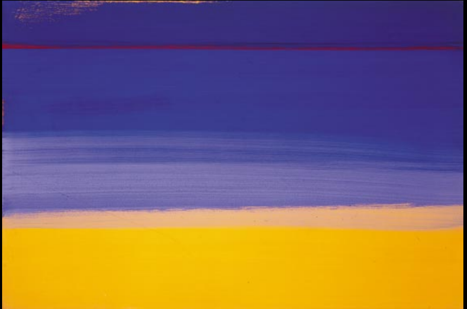
"SONNE- LICHT- WASSER", 2001, 107 X 71 CM

STEFAN MORITZ BECKER | MALEREI AUF LEINWAND 1999 - 2002