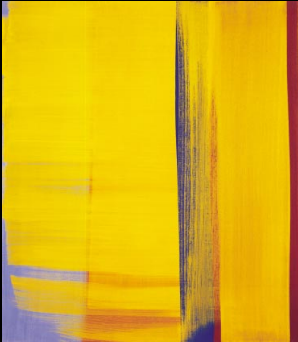
"SWING GELB!", 2000, 77 X 88 CM