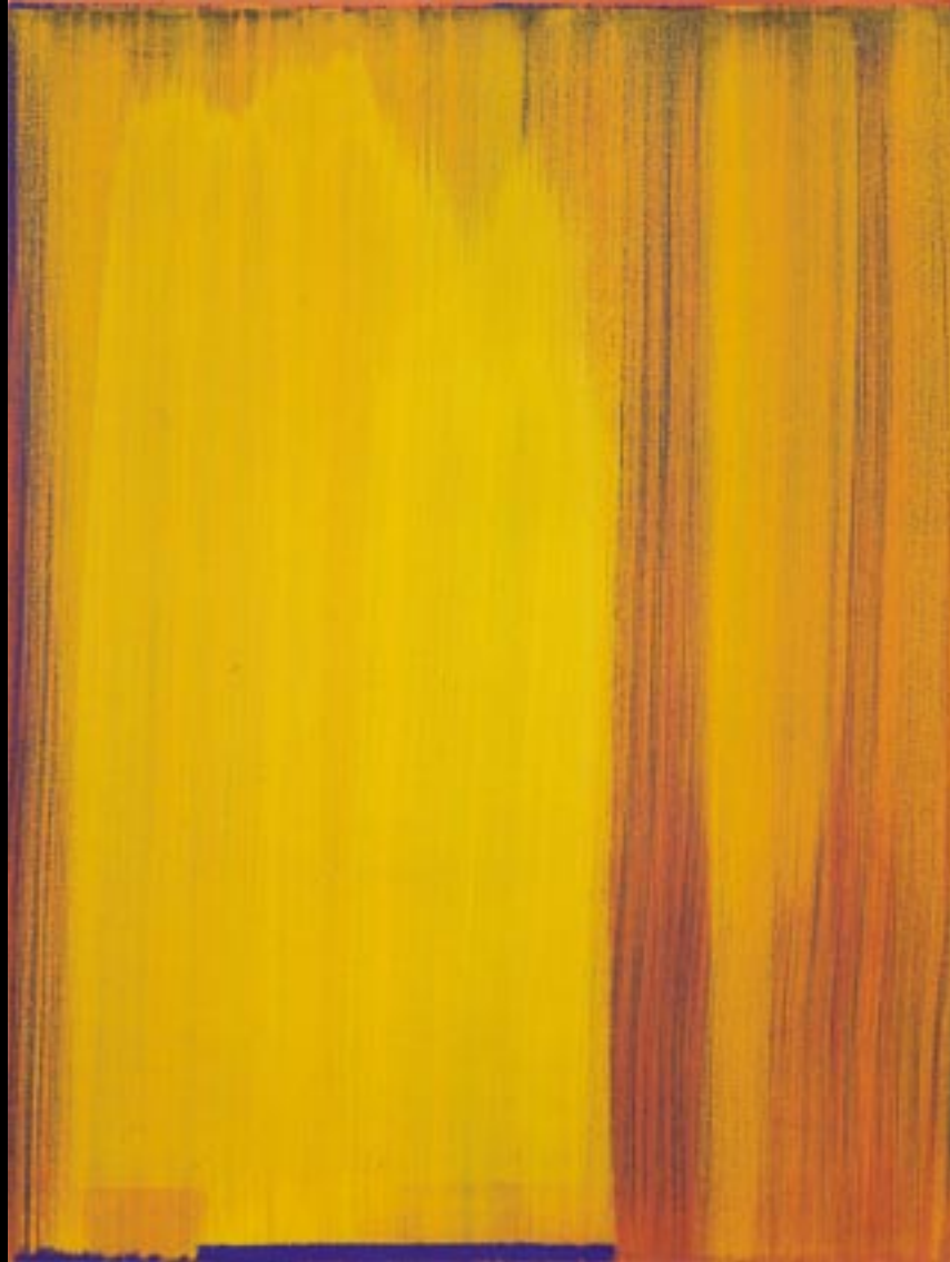
"GELBES LICHT I", 2001, 58 X 77 CM