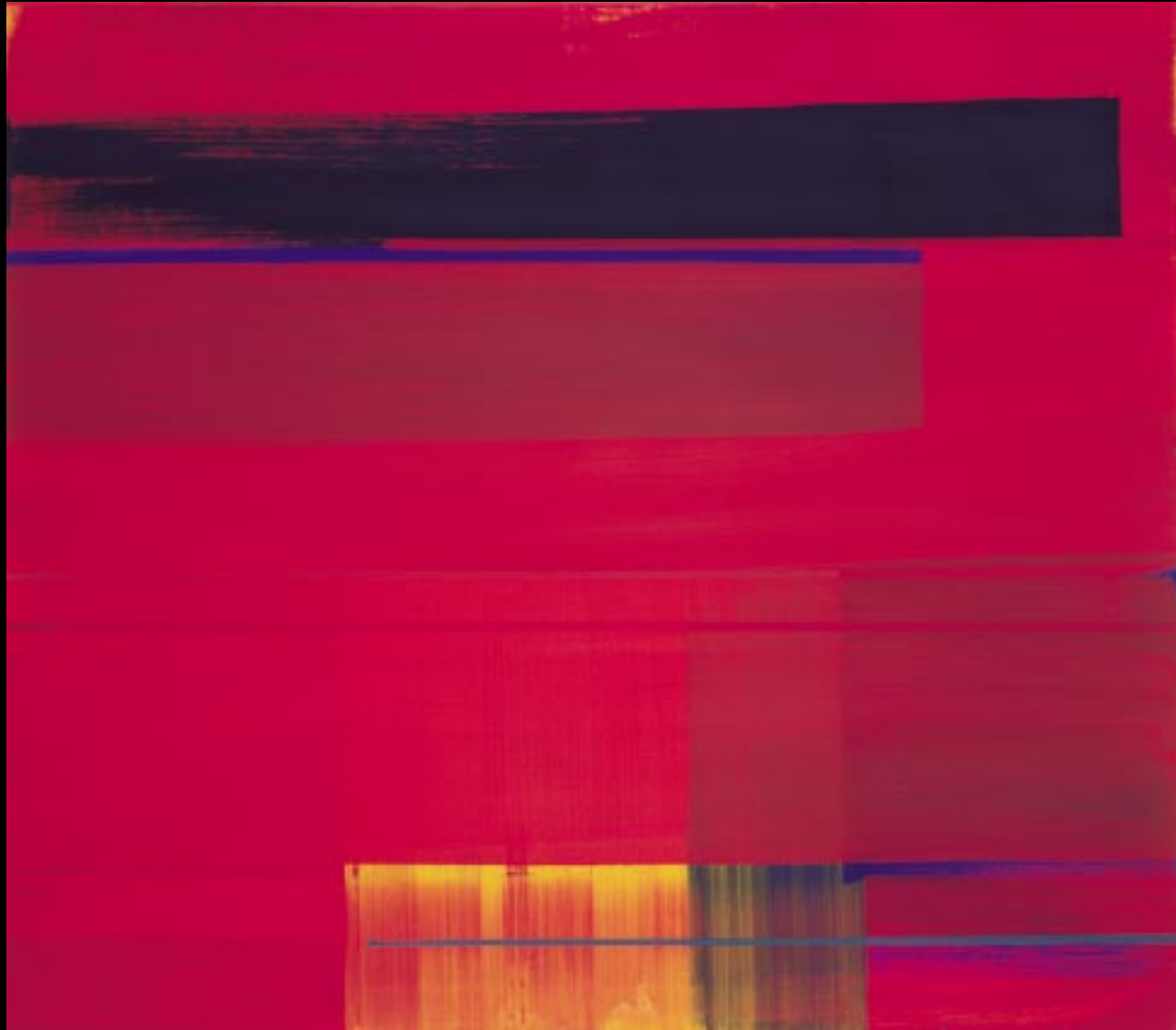
"ROTES BILD", 2000, EITEMPERA MIT PIGMENT AUF NESSEL, 122 X 107 CM, GERAHMT