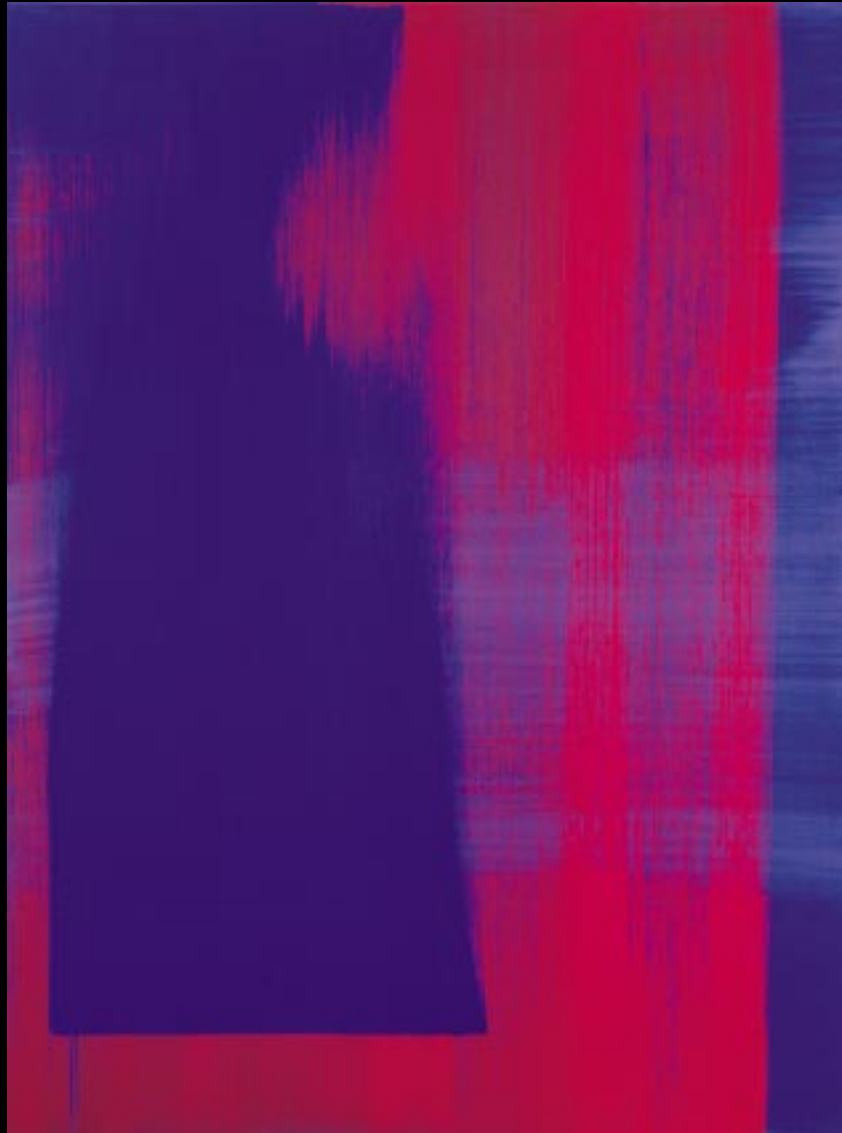
"BLAU UND ROT, FALLEND/ STEIGEND", 2000, 58 X 77 CM