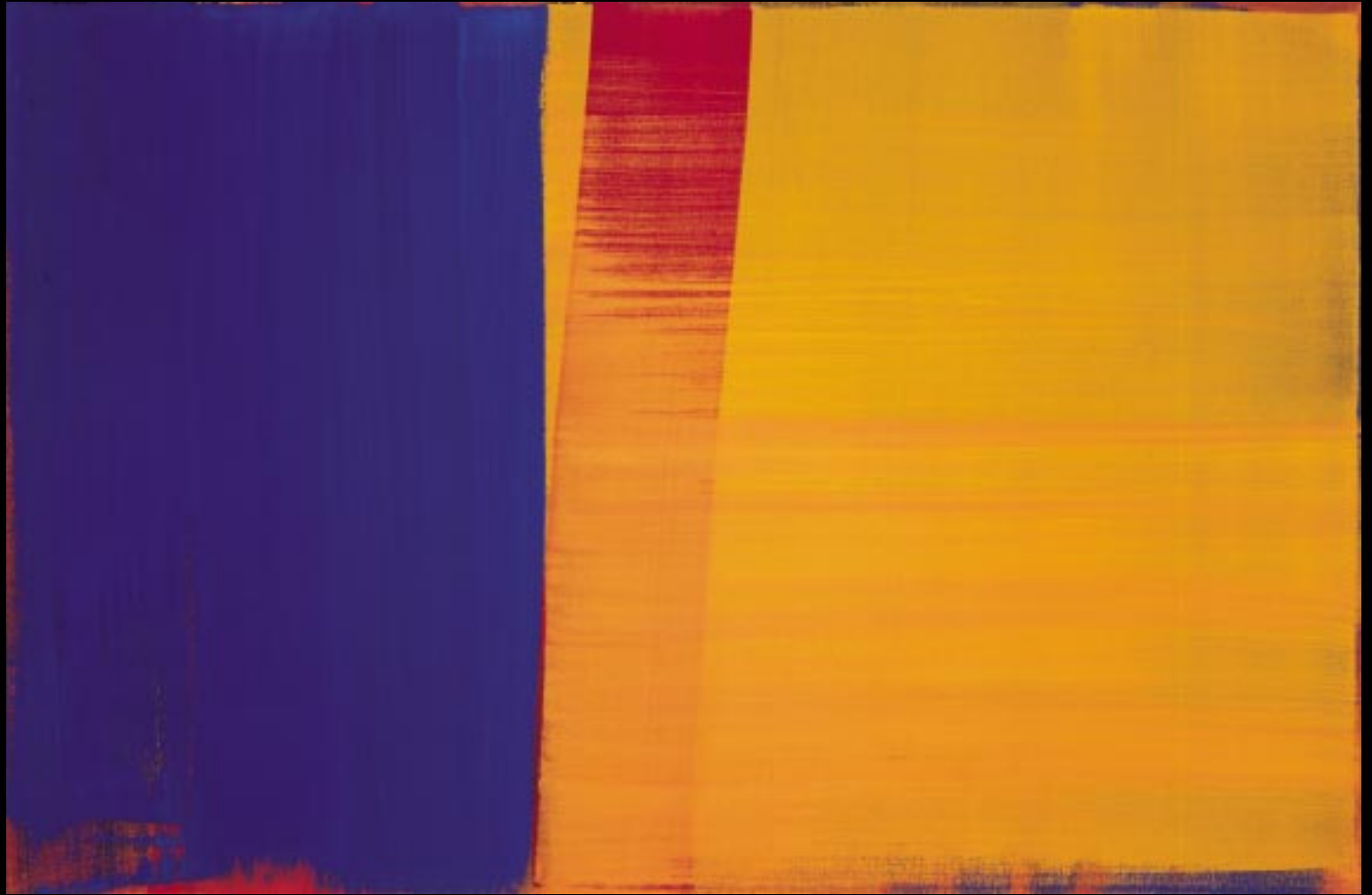
"LICHTRÄUME", 2001, 107 X 71 CM