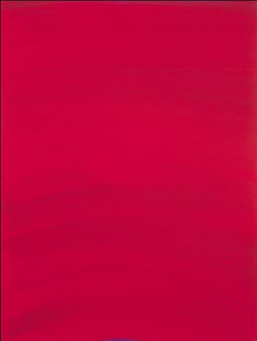
"ROTES KREISEN", 2000, 58 X 77 CM