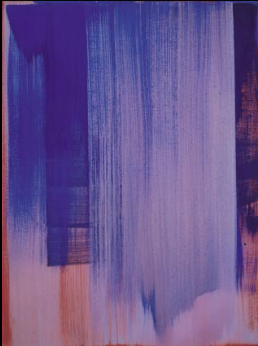
"VERHAGEN", 2000, 58 X 77 CM