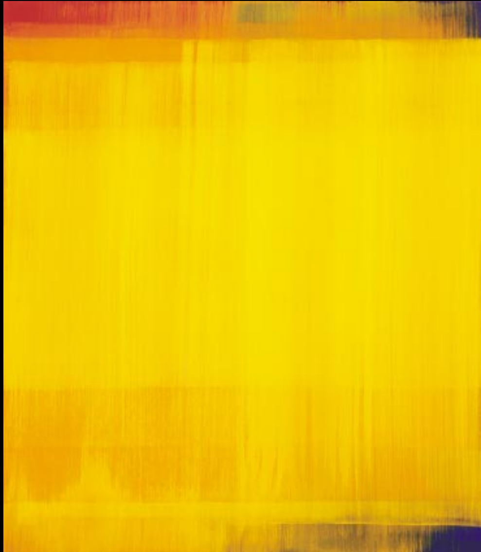
"SCHICHTUNG, GELB", 2002, 77 X 88 CM