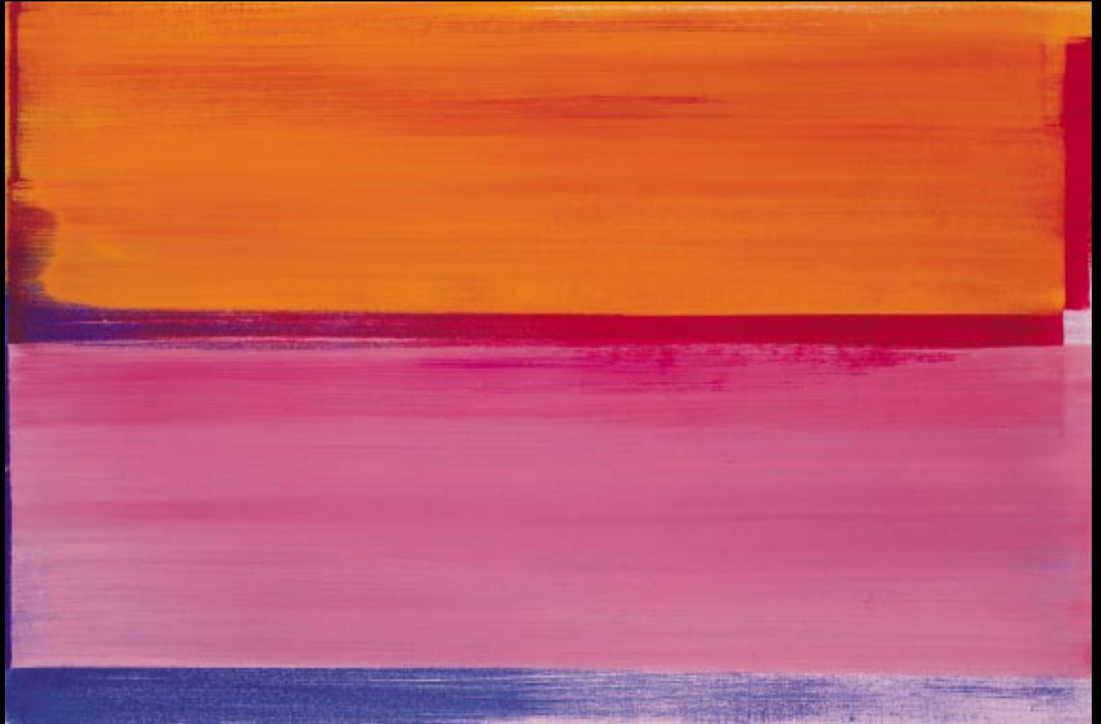
"LANDSCHAFTLICH", 2001, 107 X 71 CM