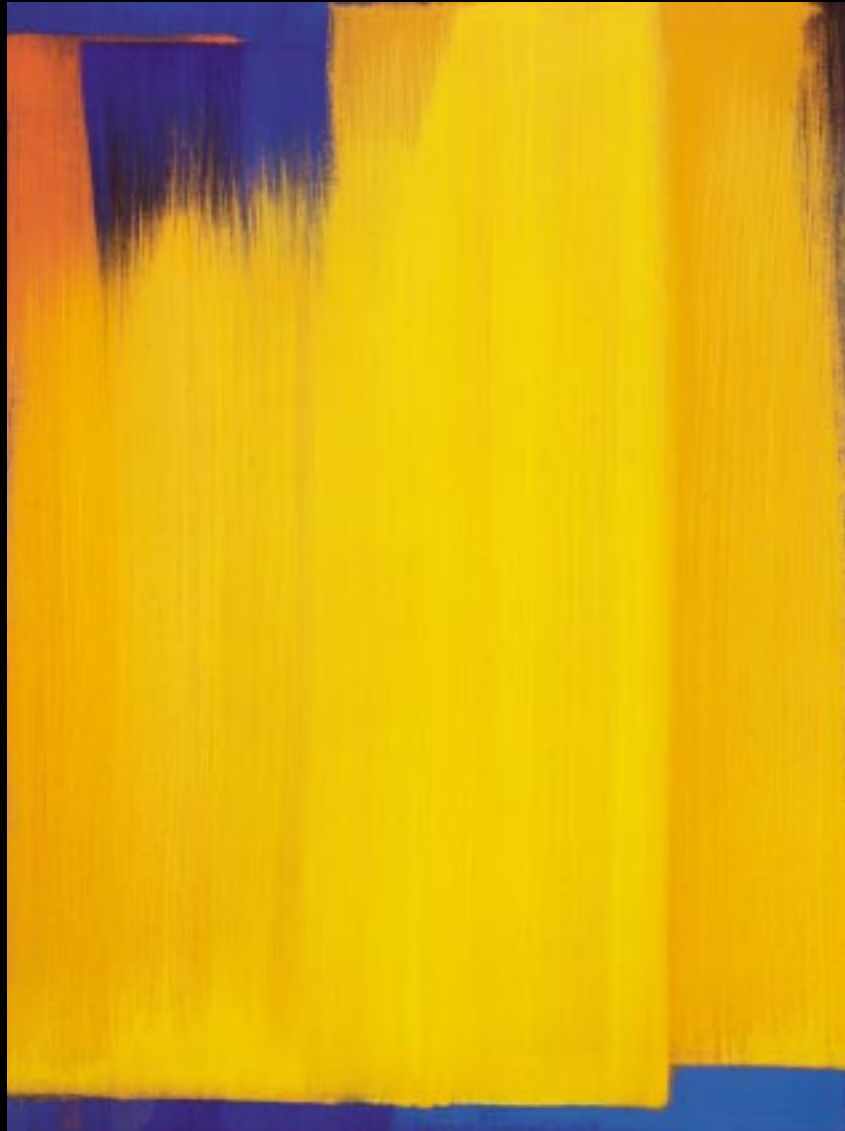
"GELBES LICHT II", 2001, 58 X 77 CM