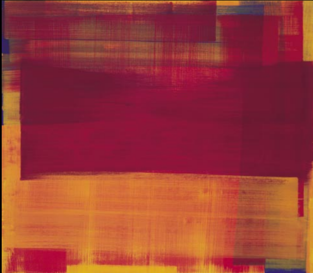
"FARBE ALS STOFF ALS BILD", 2001, 122 X 107 CM